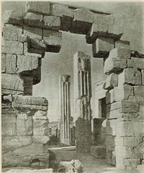
EGIPTO.—Templo de Karnak

muestran el poder extraordinario de que estaban investidos los gobernantes y sacerdotes egipcios que podian mantener ejércitos de trabajadores, ingenieros, escultores y artistas trabajando todo el tiempo en grandes obras arquitectónicas.