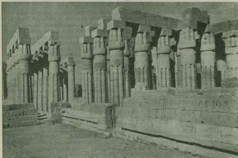
EGIPTO. — Templo de Luxor

pirámides tenía, cuando se construyó, 146 metros de altura; contenía más de 2.300.000 bloques de piedra, cuyo peso era, por término medio de dos y media toneladas cada uno. El historiador griego Herodoto escribió que 100.000 hombres trabajaron tres meses al año durante 20 años para construirla, sin emplear otro dispositivo que la palanca, el rodillo y el plano inclinado; los períodos de trabajo eran cortos debido a que los trabajadores podían