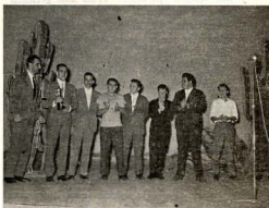
Los componentes del C. P. Horta, en el acto de la entrega del Trofeo, Copa San Luis 1959.