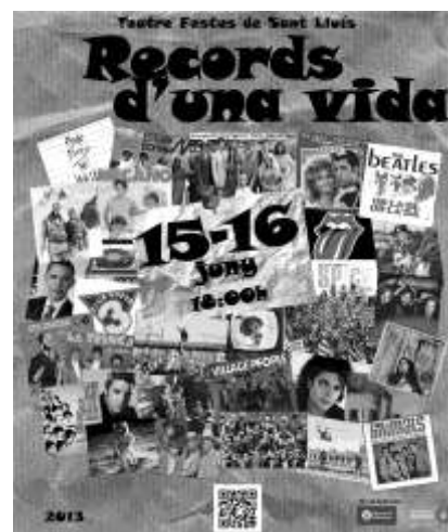
Records d'una vida