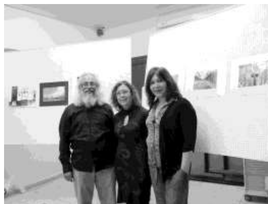
Membres del Jurat