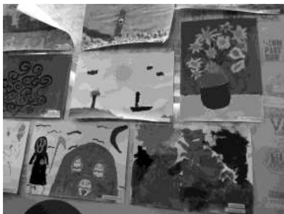
Una petita mostra de les pintures infantils